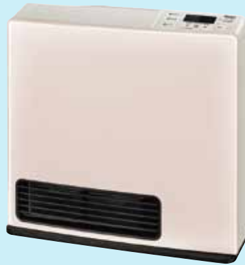
パステルローズ 《リンナイ SRC-364E》 オープン価格