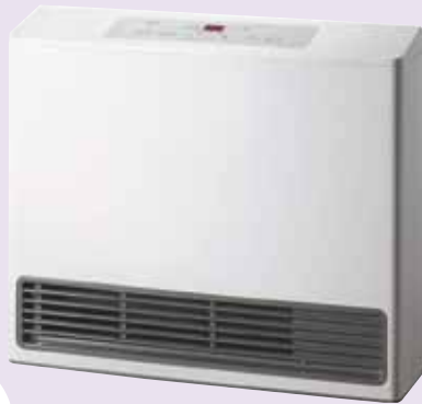
スノーホワイト 《ノーリツ GFH-5802S》 定価 92,664円(税込)