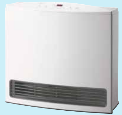
スノーホワイト 《ノーリツ GFH-4004S》 オープン価格